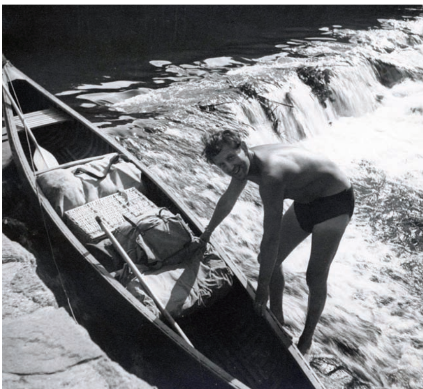
Chotěbořský továrník při sjíždění Vltavy, léto 1939