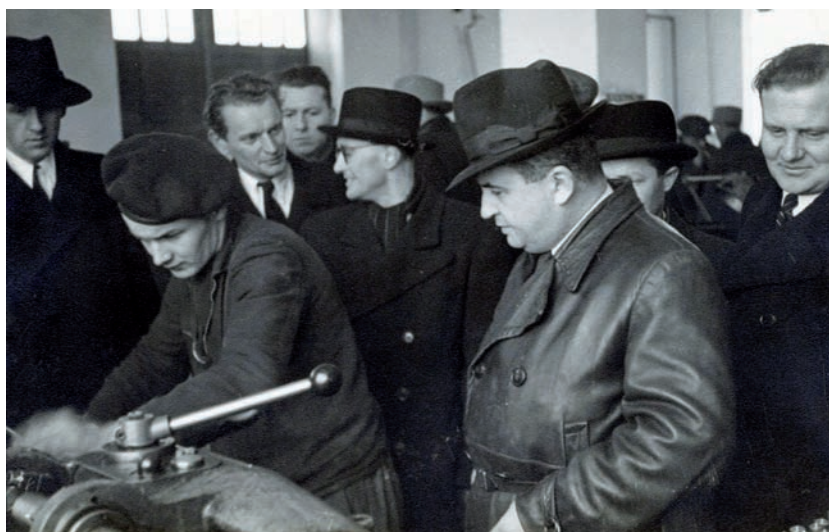
Ministr průmyslu Bohumil Laušman v chotěbořské továrně, leden 1947

Koncem dubna 1945 se v Chotěboři zdálo být osvobození na dosah: Deset dní před plánovaným započatím revoluce dávám zaměstnancům v podniku dovolenou a nechávám v továrně pouze ochrannou četou 60 mužů, s kterými také zahajujeme 5. května zároveň s Prahou odboj. Vzhledem ke krajně nešťastné pozici Chotěboře se dostáváme po jednodenním osvobození znovu do sféry ustupující armády Schörnerovy. Jen ryzím štěstím se mi 6. května podařilo zachránit sebe i 68 ostatních zatčených před zastřelením a po pohnutých třech dnech končí 9. května bojo-