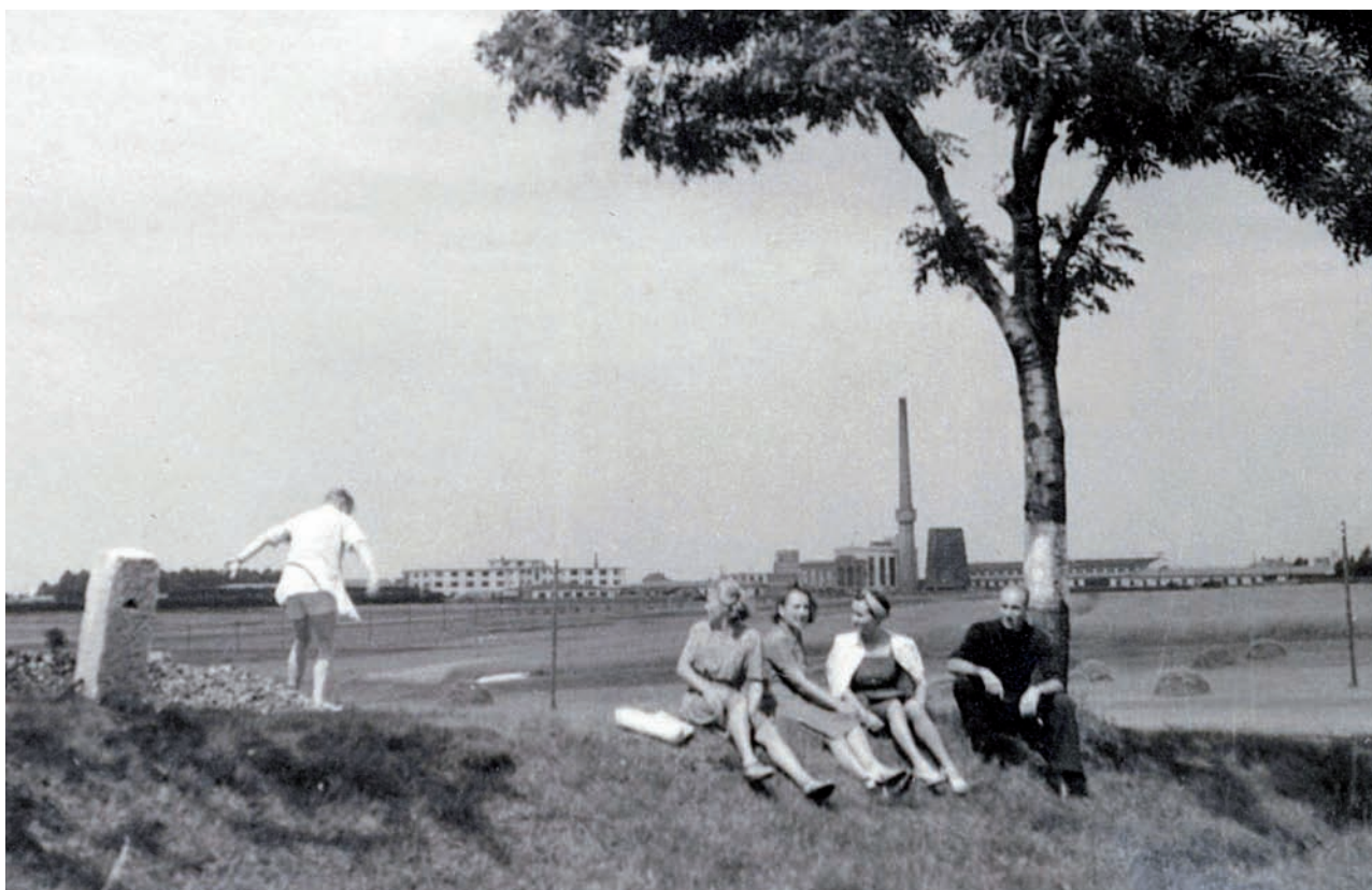
Továrna Eckhardt a spol. v Chotěboři